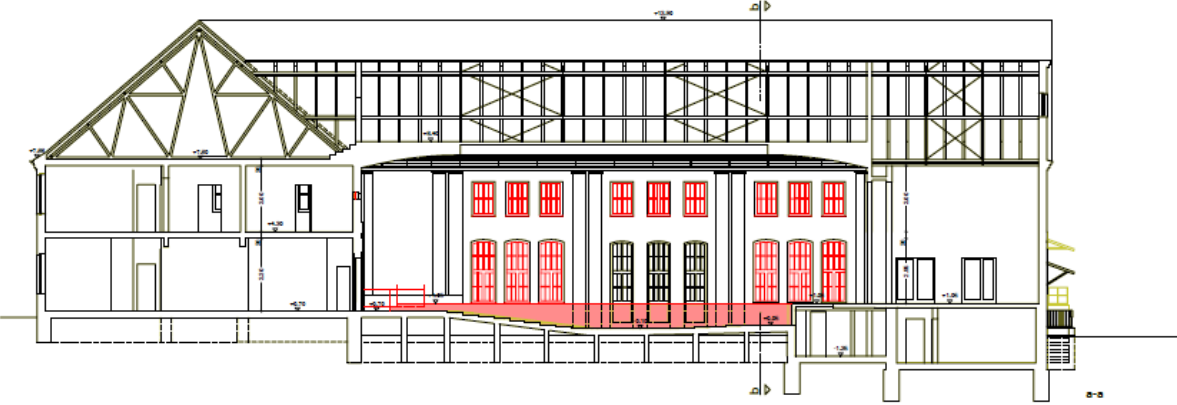
Auszug Schnitt zum Bauantrag