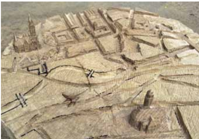
Tobias Michael (Stadtreief zum Ertasten für Blinde und Sehschwache ist noch in Bearbeitung)