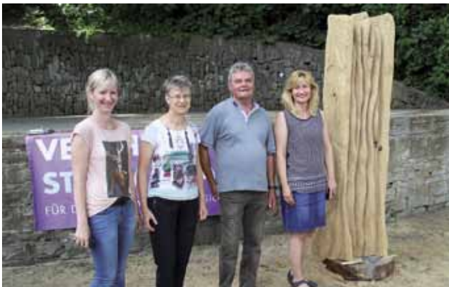
Peter Eberlein (Holzfigur für die Stadtwerke)